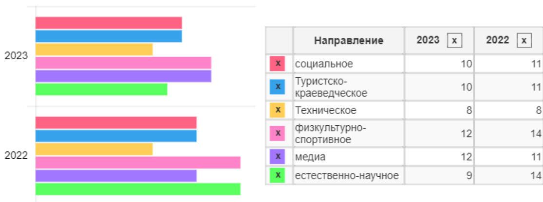
Направления дополнительного образования, которые осваивали обучающиеся

Данные о выборе направленностей дополнительного образования по годам представлены в гистограмме.